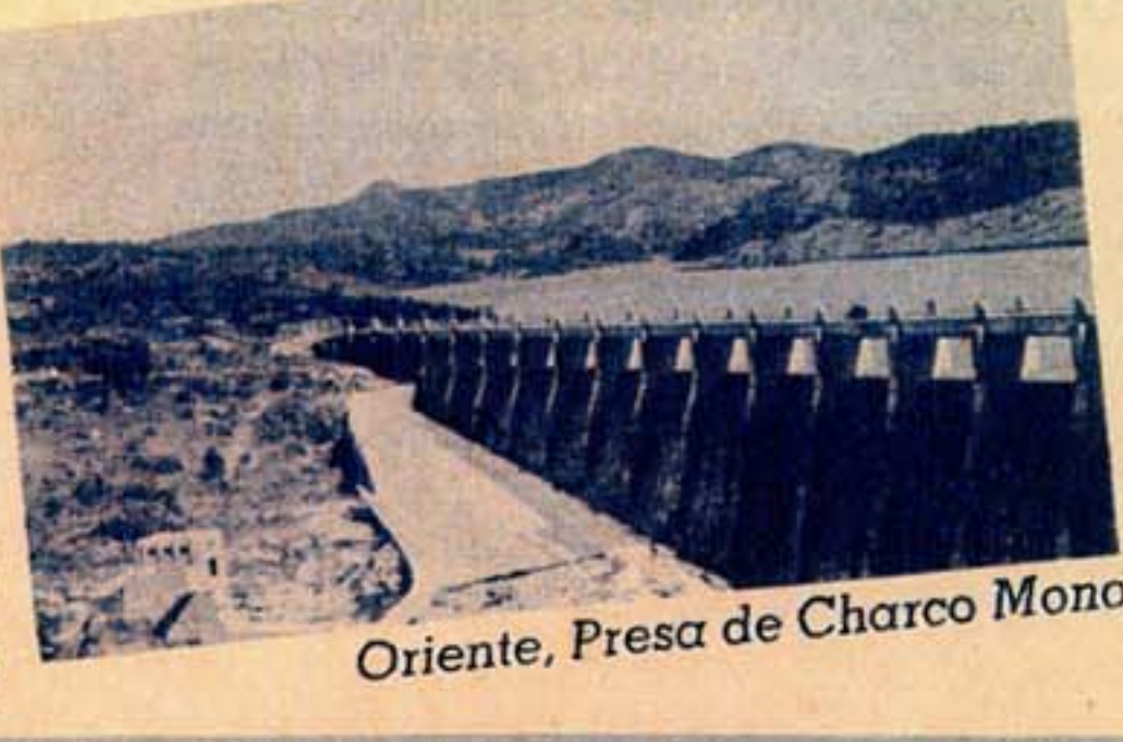
Oriente, Presa de Charco Mono