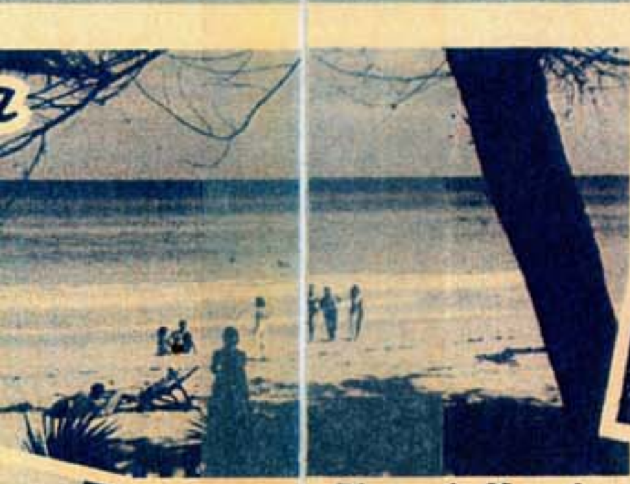
Playa de Varadero