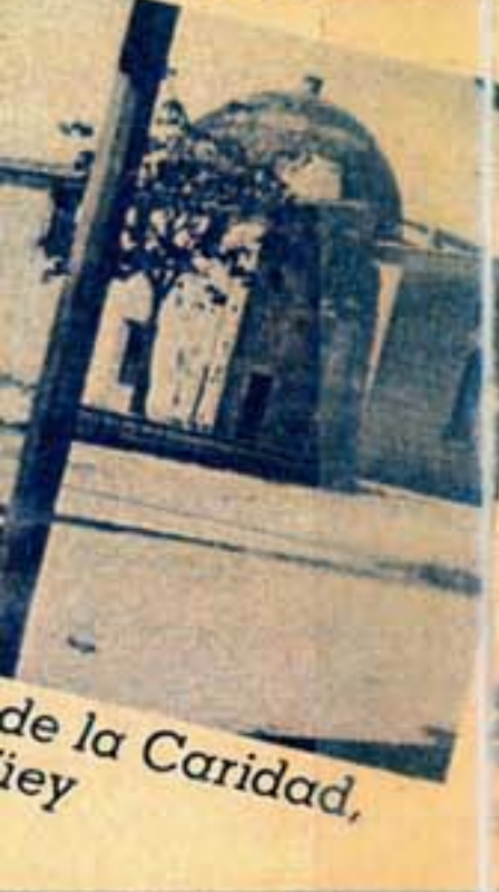
de la Caridad, ey