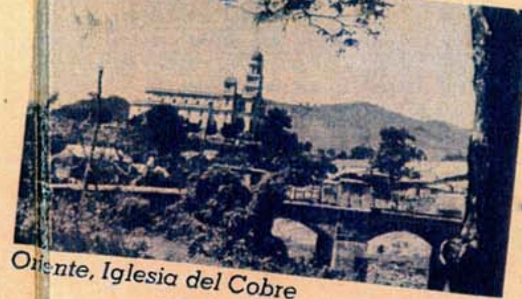
Oriente, Iglesia del Cobre