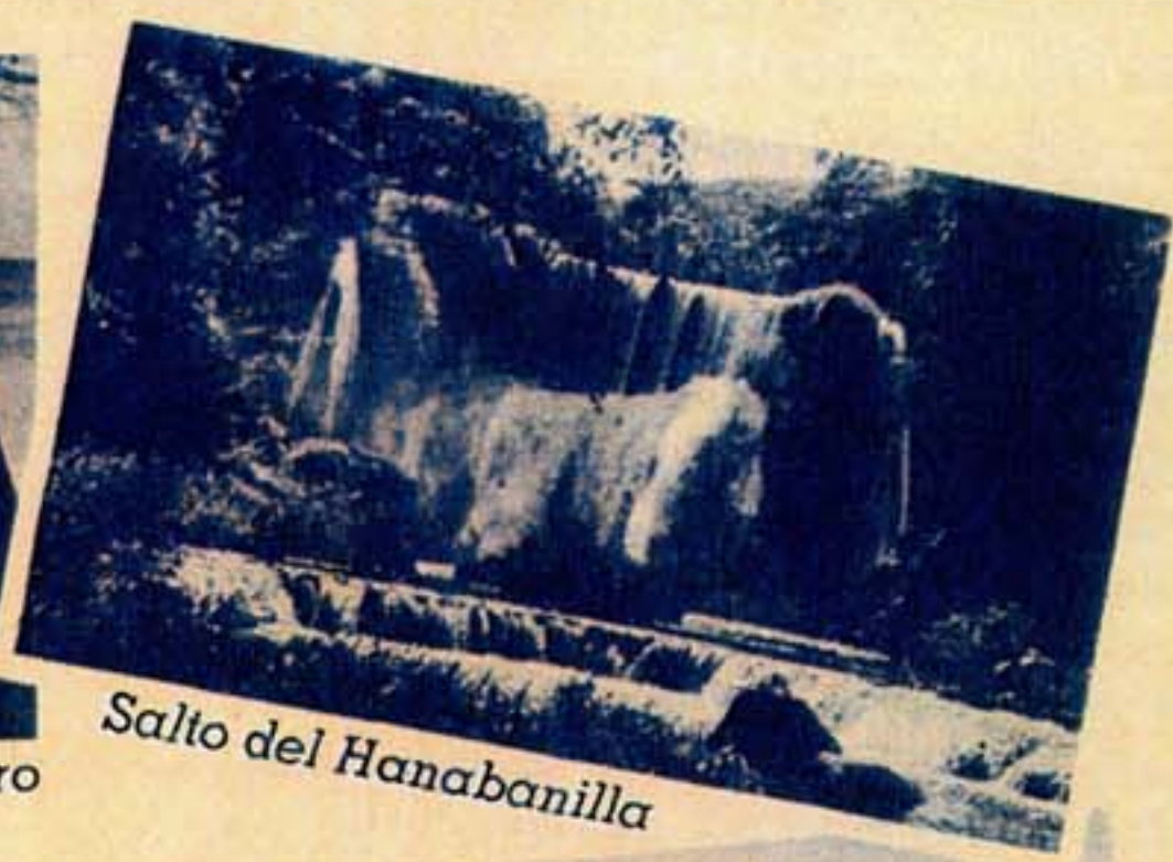
Salto del Hanabanilla