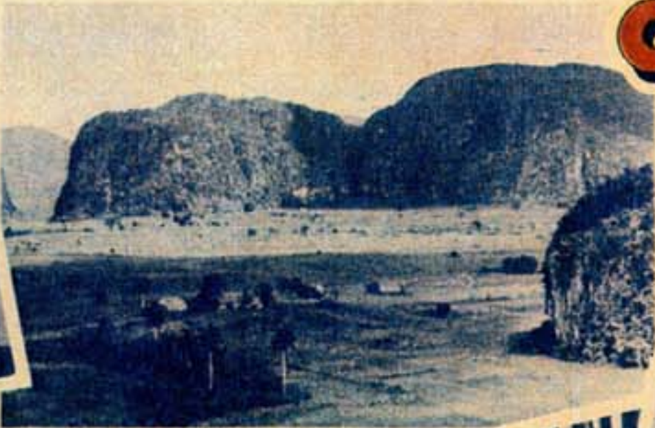
Valle de Viñales