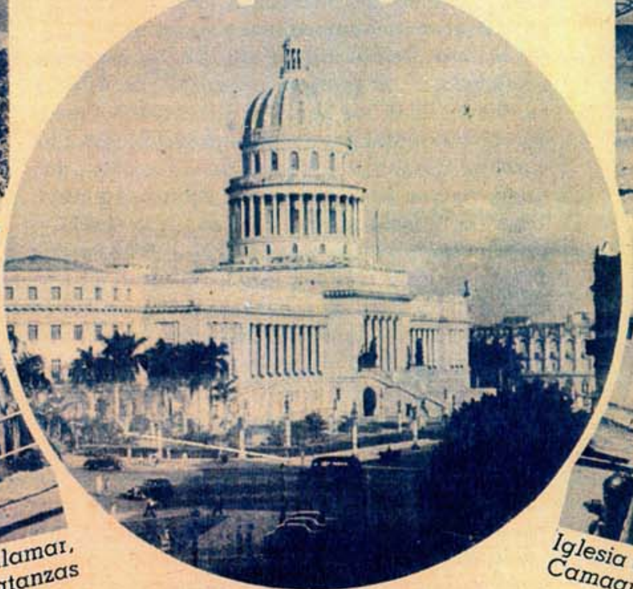
Habana, Capitolio Nacional